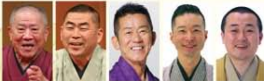
桂ざこば 桂南光 三遊亭円楽 桂紅雀 桂そうば