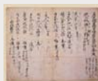
重要文化財 藤原俊成筆 公卿補任

記念講演会 冷泉為人(冷泉家第25代当主)・村井康彦(歴史学者) 2015.12.6(Sun) 10:30~ 同博物館 3階 フィルムシアター ※要事前申込 詳細は文化博物館HPをご覧ください。 http://www.bunpaku.or.jp