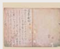
国宝 藤原俊成筆 古来風鉢抄