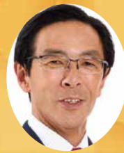
京都府知事 西脇 隆俊

「Kyoto演劇フェスティバル」が、府民の皆様とともにこのたび46回目を迎えますことを大変嬉しく思いますとともに、ここまで続けられてきたのも、多くの方々の御尽力と御協力の賜物であり、心より感謝を申し上げます。